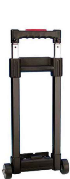
Trolley 2-étages Poignée extensible 420 - 960 mm