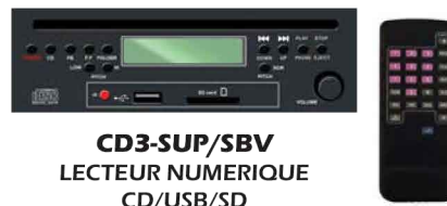
CD3-SUP/SBV LECTEUR NUMERIQUE CD/USB/SD