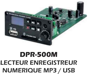
DPR-500M LECTEUR ENREGISTREUR NUMERIQUE MP3 / USB