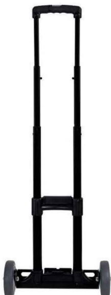
Trolley 3-étages Poignée extensible 392 - 980 mm Grandes roues